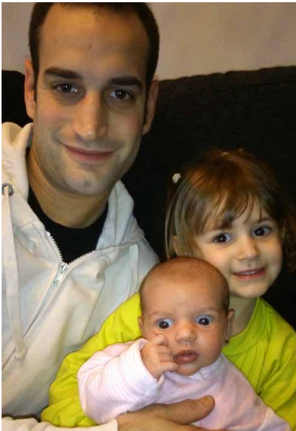
Part en família