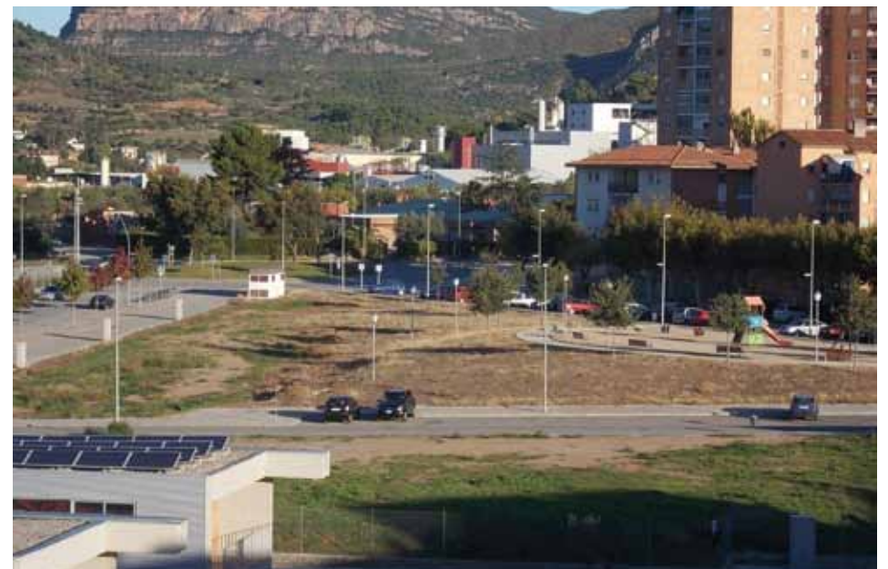
El pavelló, en marxa