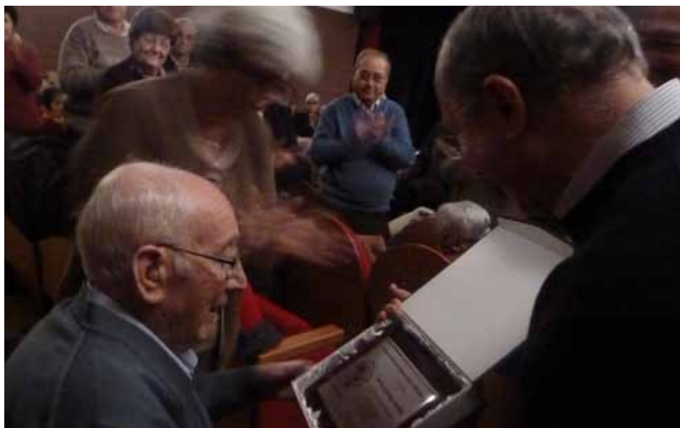
Soci número 1

El periòdic 08640 no es fa responsable del contingut de les cartes (opinions, comentaris, rèpliques i suggeriments d'interès general, respectuosos cap a les persones i institucions), i es reserva el dret de publicar-les i resumir-les si és necessari. Els articles que no es publiquen en aquesta edició per falta d'espai, sortiran a les properes edicions. Les cartes per a aquesta secció han de signar-se amb el nom i cognom de l'autor, DNI, telèfon i adreça. S'han d'adreçar al tel: 635 810 173 o a l'a/e: periodic08640@hotmail.com