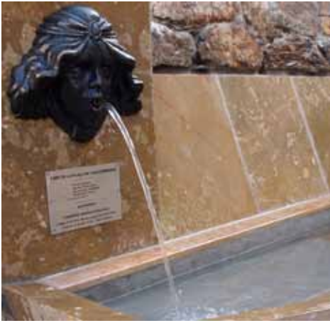
Can Carreras ja té font