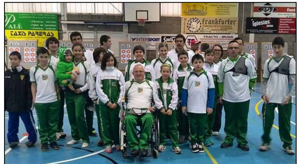
Els arquers olesans

Tir Arc Olesa arrasa al Campionat de Catalunya (Palafugell) amb 16 medalles i amb 8 títols de campions. Amb la participació de 175 esportistes, 23