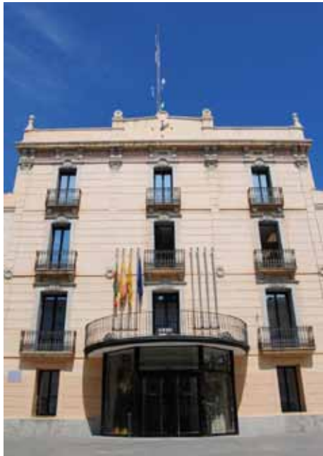
Sense pis buits

La Brigada Municipal d'Obres i Serveis d'Olesa posa en marxa una nova planificació de treball de cara al manteniment de la via pública i impulsa actuacions a tots els barris d'Olesa. El nou sistema organitzatiu de la brigada incorpora els conceptes de treball "correctiu i preventiu" de manera que no s'actua sempre un cop detectat un problema, sinó abans que aparegui. Per això, des de la brigada ja es treballa en la detecció d'actuacions que, tot i no ser urgents, s'hauran de fer a curt o mitjà termini de manera que es pugui intervenir abans que l'actuació esdevingui de caràcter urgent.