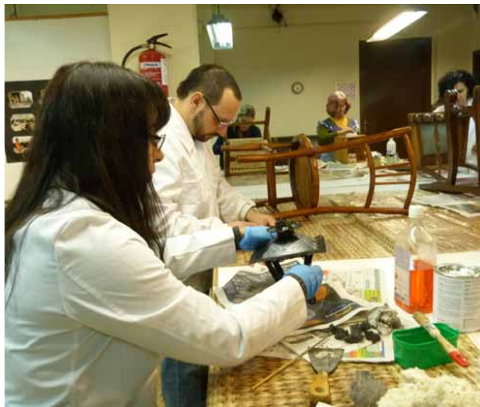
Els restauradors olesans

Una quinzena d'alumnes van començar el tercer taller de restauració de mobiliari antic, projecte impulsat per l'Ajuntament, i continuaran la tasca de recuperació de mobiliari que forma part del patrimoni històric municipal mentre s'endinsen en el coneixement del món de la restauració de mobles. Per aquests tallers, a l'Escola d'Arts i Oficis, ja hi han passat 45 persones tot i que, en alguns cassos, són alumnes que han decidit "repetir" després d'haver participat en alguna de les edicions anteriors.