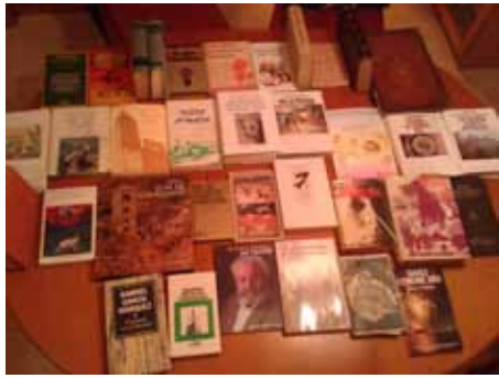
Cultura per terra

Habla de mí como si fuese un dictador, pero a la vez impone una bandera a todos sea o no de esa ideología, una muestra muy sutil de manipular a su gusto el pensamiento de los demás. Decir lo que he contestado anteriormente, que somos muchos los catalanes que pensamos de manera diferente y que soñamos de manera distinta aunque le animo a seguir soñando, pero no imponga sus ideas a los demás: ya estuvimos así 40 años. Recordarle que hoy por hoy Cataluña es libre, ponga usted en su casa lo que quiera pero no en lo de todos; le pido respeto a los derechos individuales de las personas que es lo máspreciado en cualquier