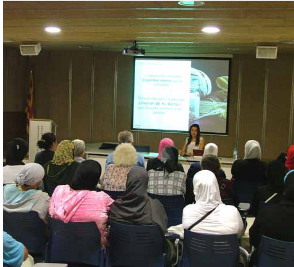
Xerrades per a dones

La font recorda un vell safareig on cauen dos punts d'aigua, el provinent de l'angelet (una rèplica dels que hi ha a la plaça de Les Fonts) i d'on raja aigua potable, i un brollador. També una pla-